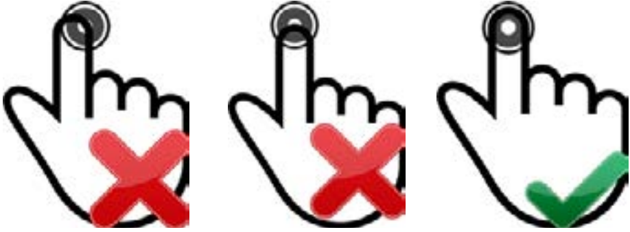
Şekil 4: Dokunmatik Uyarılar

Cihazı kullanırken parmağınızın butona tam olarak dokunduğundan emin olunuz. Lütfen aşağıdaki Şekil 4 deki görseli dikkate alınız: