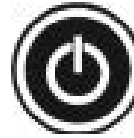
Şekil 5: Fırını Açma/Kapama Butonu

Cihazın elektrik bağlantısını 3'üncü bölümde belirtilen hususları dikkate alarak yaptıktan sonra fırınınızı açmak/kapatmak için "Fırını Açma/Kapama Butonuna" basılı tutunuz. "Fırını Açma/Kapama Butonu" Şekil 5'te belirtilmiştir.