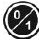
Şekil 6: Fırını Çalıştırma/Durdurma Butonu

Fırınız açık iken fırınınızı çalıştırmak veya durdurmak için "Fırını Çalıştırma/Durdurma Butonuna" basılı tutunuz. "Fırını Çalıştırma/Durdurma Butonu" Şekil 6'da belirtilmiştir.