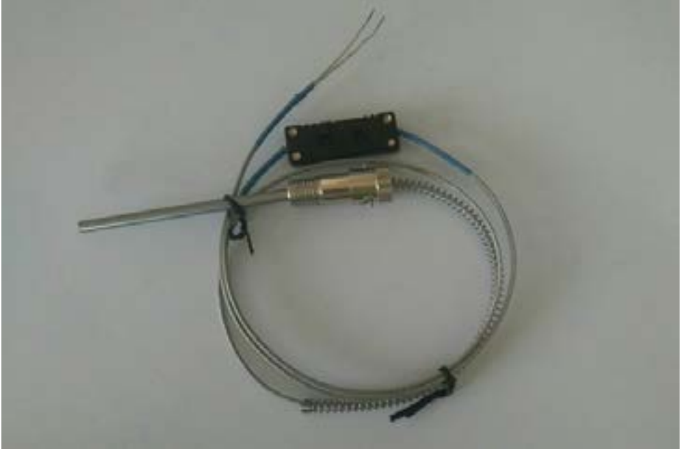
Şekil 11: AKE.SNS.TMP.002 Isı Sensörü