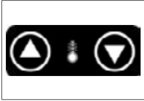
Şekil 8: Sıcaklık Ayarlama Butonları

Pişirme sıcaklığını ayarlamak için "Sıcaklık Ayarlama Butonlarına" dokununuz. Sıcaklığı artırmak için "yukarı" butonuna, azaltmak için "aşağı" butonuna dokununuz ve set değerini ayarlayınız. Pişirme esnasında fırın içi sıcaklık değeri "Sıcaklık Ayarlama Butonlarının" üstünde yer alan 3 basamaklı 7 segment ekranda gösterilmektedir. "Sıcaklık Ayarlama Butonları" Şekil 8'de gösterilmiştir.