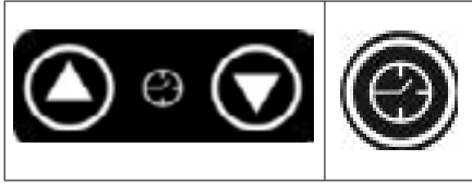
Şekil 7: Zaman Ayarlama Butonları ve Timer Butonu

Pişirme zamanını ayarlamak için "Zaman Ayarlama Butonlarına" dokununuz. Zamanı artırmak için "yukarı" butonuna, azaltmak için "aşağı" butonuna dokununuz. Pişirme zamanı set değeri "Zaman Ayarlama Butonlarının" üstünde yer alan 3 basamaklı 7 segment ekranda gösterilmektedir. Pişirme zamanını devre dışı bırakmak için "Timer" butonuna dokununuz. Pişirme zamanı devre dışı olduğunda 3 basamaklı 7 segment ekranda "---" ibaresi gösterilir. "Zaman Ayarlama Butonları" ve "Timer" butonu sırasıyla Şekil 7'de gösterilmiştir.